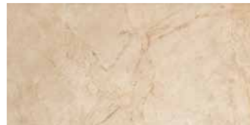
CASSIA (BEIGE) 46 G8532A LAPPATO RETTIFICATO 32,1x64,2 - 12,6"x25,3"