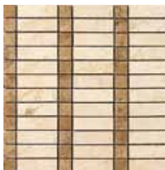
G84223 LINEAR DOT MOS 22 (BEIGE/NOCE) 32,1x32,1 - 12,6"x12,6"