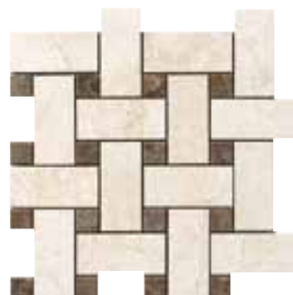
G84214 BASKET WEAVE 22 (BIANCO/NERO) 32,1x32,1 - 12,6"x12,6"