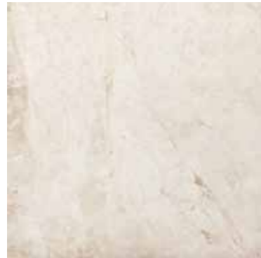
FLAMINIA (BIANCO) 46 G8431A LAPPATO RETTIFICATO 48,15x48,15 - 19"x19"