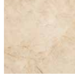
CASSIA (BEIGE) 61 G8342A LAPPATO RETTIFICATO 32,1x32,1 - 12,6"x12,6"