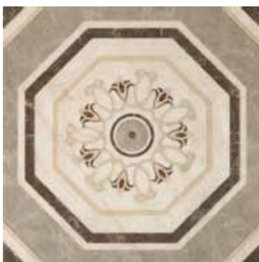
G84221 FLAMINIA ROSONE OTTAGONA 50 48,15x48,15 - 19"x19"