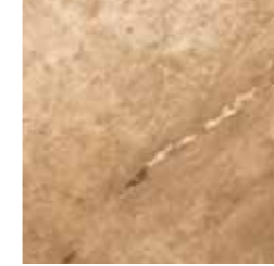
AURELIA (NOCE) 61 G8343A LAPPATO RETTIFICATO 32,1x32,1 - 12,6"x12,6"