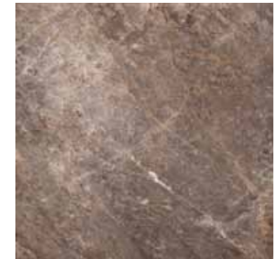
SALARIA (NERO) 46 G8434A LAPPATO RETTIFICATO 48,15x48,15 - 19"x19"