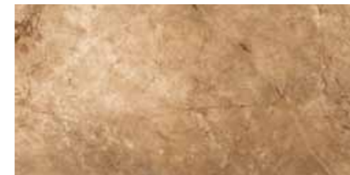
AURELIA (NOCE) 46 G8531A LAPPATO RETTIFICATO 32,1x64,2 - 12,6"x25,3"