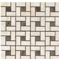
G84216 PIN WHEEL MOS 22 (BIANCO/NERO) 32,1x32,1 - 12,6"x12,6"