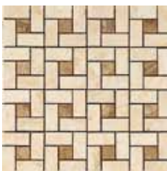
G84226 PIN WHEEL MOS 22 (BEIGE/NOCE) 32,1x32,1 - 12,6"x12,6"