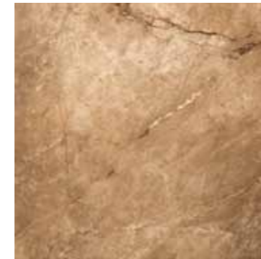
AURELIA (NOCE) 46 G8443A LAPPATO RETTIFICATO 48,15x48,15 - 19"x19"