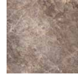
SALARIA (NERO) 61 G8344A LAPPATO RETTIFICATO 32,1x32,1 - 12,6"x12,6"