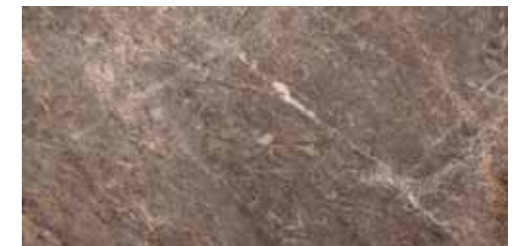
SALARIA (NERO) 46 G8534A LAPPATO RETTIFICATO 32,1x64,2 - 12,6"x25,3"