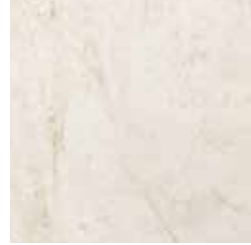
FLAMINIA (BIANCO) 61 G8341A LAPPATO RETTIFICATO 32,1x32,1 - 12,6"x12,6"