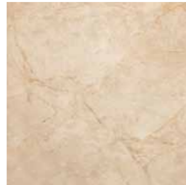
CASSIA (BEIGE) 46 G8432A LAPPATO RETTIFICATO 48,15x48,15 - 19"x19"