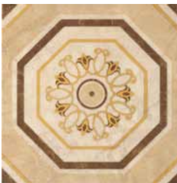
G83227 CASSIA ROSONE OTTAGONA 50 48,15x48,15 - 19"x19"