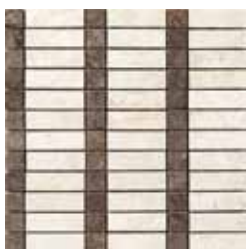
G84213 LINEAR DOT MOS 22 (BIANCO/NERO) 32,1x32,1 - 12,6"x12,6"