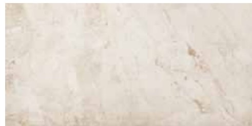
FLAMINIA (BIANCO) 46 G8533A LAPPATO RETTIFICATO 32,1x64,2 - 12,6"x25,3"