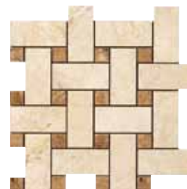
G83224 BASKET WEAVE 22 (BEIGE/NOCE) 32,1x32,1 - 12,6"x12,6"